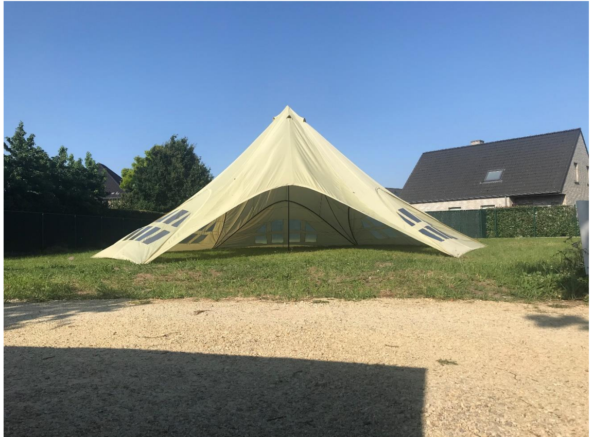
Foto: Proef opstelling tent.